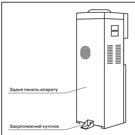
Мал. 2. Фіксація апарату

Переконайтеся в тому, що параметри електромережі відповідають параметрам, зазначеним на табличці з технічними даними, розташованій на задній стінці апарату.